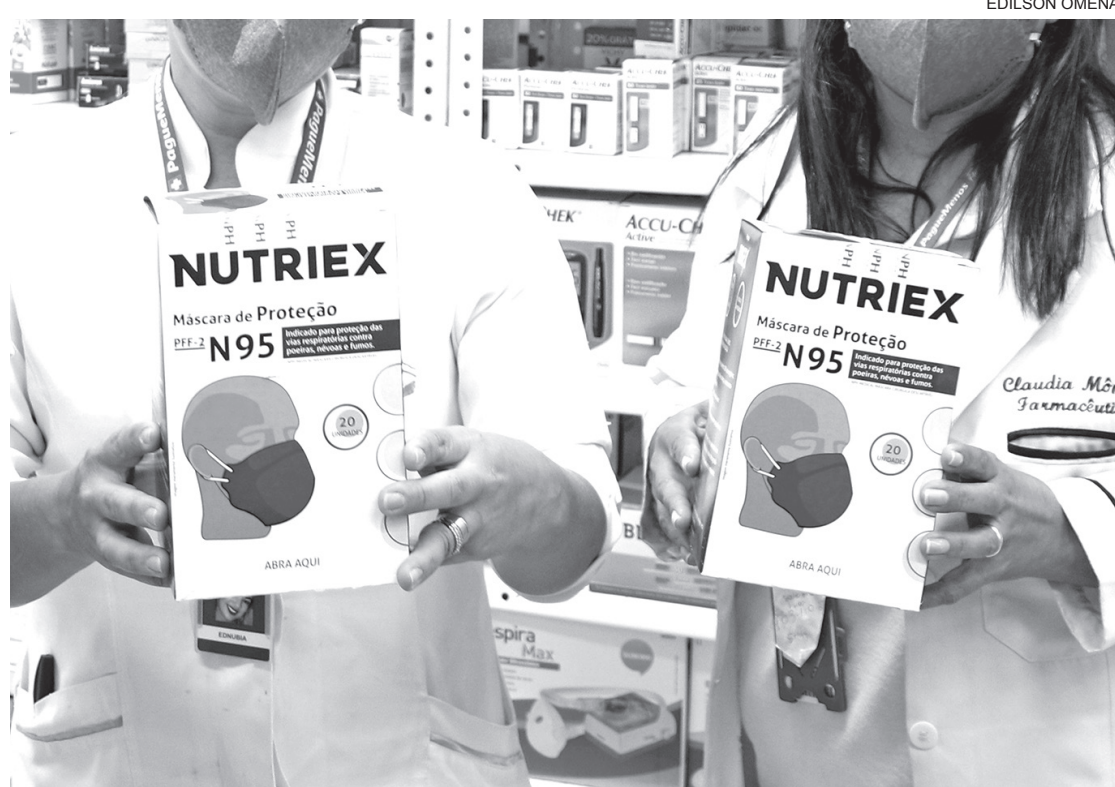
Antes da pandemia, máscaras N95 e PFF2 custavam entre R$ 6 e R$ 8, agora estão entre R$ 25 e R$ 45

No local, além das máscaras cirúrgicas e a máscara n95, é possível o cliente encontrar as máscaras em tricoline e 100% algodão, TNT e viseira de acetato. Vale ressaltar que as duas primeiras não têm em pronta entrega. Ainda, segundo informações repassadas pelo marketing, a procura aumentou consideravelmente. E no estabelecimento, não há limite de vendas por pessoa, o cliente pode comprar quantas