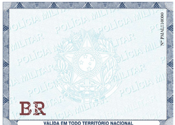
Foto 01: Modelo do espelho de CRAF/PAF, conforme descrições contidas no item 4.1.2.1.